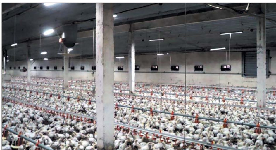
Рис. 6. Корпуса напольного содержания бройлеров на площадке Балахоновская

сроком выращивания птицы и, как следствие, более частой мойкой и обработкой клеточного оборудования, расположением светильников непосредственно в клетке и их большим количеством. Все это предъявляет и более жесткие требования к светодиодному оборудованию. Светодиодные светильники и линии питания должны быть максимально изолированы от воздействия воды и химических реагентов, а сам корпус светильника должен быть герметичен и стоек к механическим воздействиям (во время мойки и выращивания птицы, особенно на последних этапах). Эти параметры должны обеспечиваться в течение всего срока службы системы светодиодного освещения. Специалисты нашей компании уделяют повышенное внимание совершенствованию оборудования этого класса. Одна из последних модификаций светильника для клеточного содержания цыплят-бройлеров успешно используется на ОАО «Птицефабрика Зеленецкая» (рис. 7). Светильники располагаются над каждой кормушкой и создают максимальный уровень