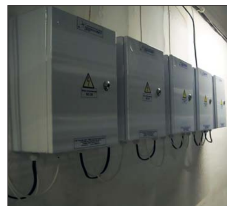
Рис. 8. Блоки сопряжения из состава светодиодной системы освещения ИСО «Хамелеон». Металлический шкаф обеспечивает оптимальный температурный режим работы электронного оборудования для максимального продления срока службы

Наша компания первой в России создала и в промышленных масштабах приступила к выпуску светодиодных систем освещения для сельского хозяйства. В частности, об этом свидетельствует полученный совместно со специалистами ВНИТИП г. Сергиев Посад приоритет на изобретение способа содержания сельскохозяйственной птицы. Благодаря особенностям применения светодиодные источники света, как показывают научные исследования, проводимые во Всероссийском научно-исследовательском и технологическом