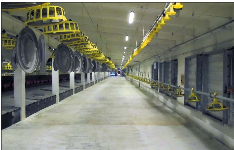
Рис. 1. Корпуса для содержания родительского стада