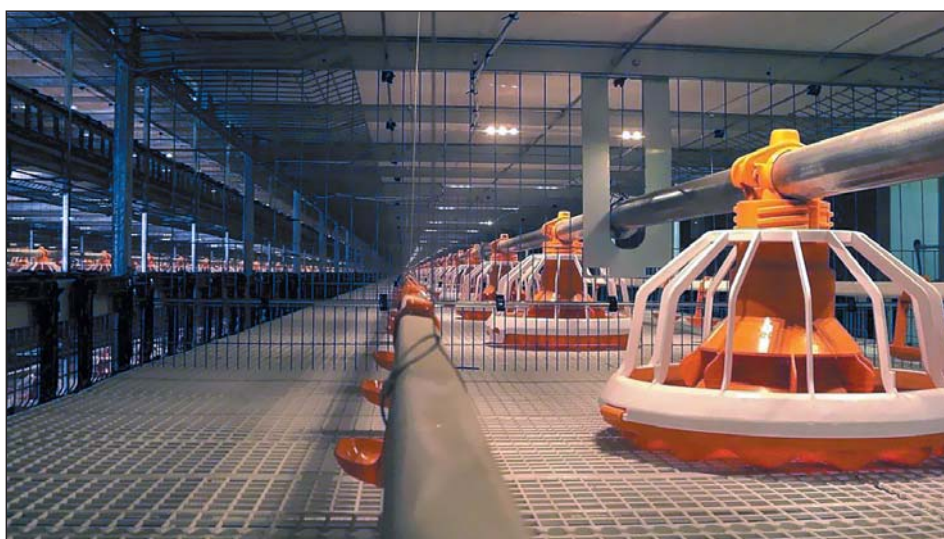
Рис. 7. Светодиодное освещение при клеточном выращивании цыплят-бройлеров

сроком выращивания птицы и, как следствие, более частой мойкой и обработкой клеточного оборудования, расположением светильников непосредственно в клетке и их большим количеством. Все это предъявляет и более жесткие требования к светодиодному оборудованию. Светодиодные светильники и линии питания должны быть максимально изолированы от воздействия воды и химических реагентов, а сам корпус светильника должен быть герметичен и стоек к механическим воздействиям (во время мойки и выращивания птицы, особенно на последних этапах). Эти параметры должны обеспечиваться в течение всего срока службы системы светодиодного освещения. Специалисты нашей компании уделяют повышенное внимание совершенствованию оборудования этого класса. Одна из последних модификаций светильника для клеточного содержания цыплят-бройлеров успешно используется на ОАО «Птицефабрика Зеленецкая» (рис. 7). Светильники располагаются над каждой кормушкой и создают максимальный уровень