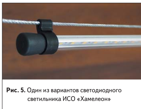
Рис. 5. Один из вариантов светодиодного светильника ИСО «Хамелеон»

Если сравнивать продолжительность работы для температур на кристалле светодиода +70 °С (точка 2) и +80 °С (точка 3), мы увидим, что возрастание температуры всего лишь на 10° приведет к сокращению срока службы светодиода примерно на 20 000 ч (более двух лет непрерывной эксплуатации). В данном случае важно то, что даже достаточно небольшое снижение температуры приводит к существенному увеличению времени жизни светодиода при фиксированном рабочем токе. Соблюдение температурного режима работы светодиода обеспечивается применением специальных технических решений, направленных на максимальное снижение разницы температур окружающей среды и светодиода. Для помещений, где содержится птица, это очень важно, так как температура в птичнике может доходить до +40...+45 °С. Наиболее экономически и технически целесообразным способом в данном случае является применение алюминиевого радиатора в конструкции корпуса светильника, на котором крепится плата со светодиодами, имеющего непосредственный контакт с окружающей средой. Таким образом здесь «отвоевывается» каждый градус температуры кристалла светодиода, что позволяет максимально продлить срок его службы. Если