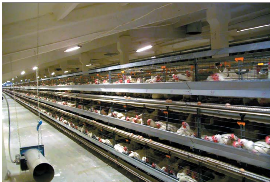
Рис. 3. Корпуса клеточного содержания ремонтного молодняка

Некоторые считают, что использовать светодиоды в сельском хозяйстве и производить осветительное оборудование на их основе