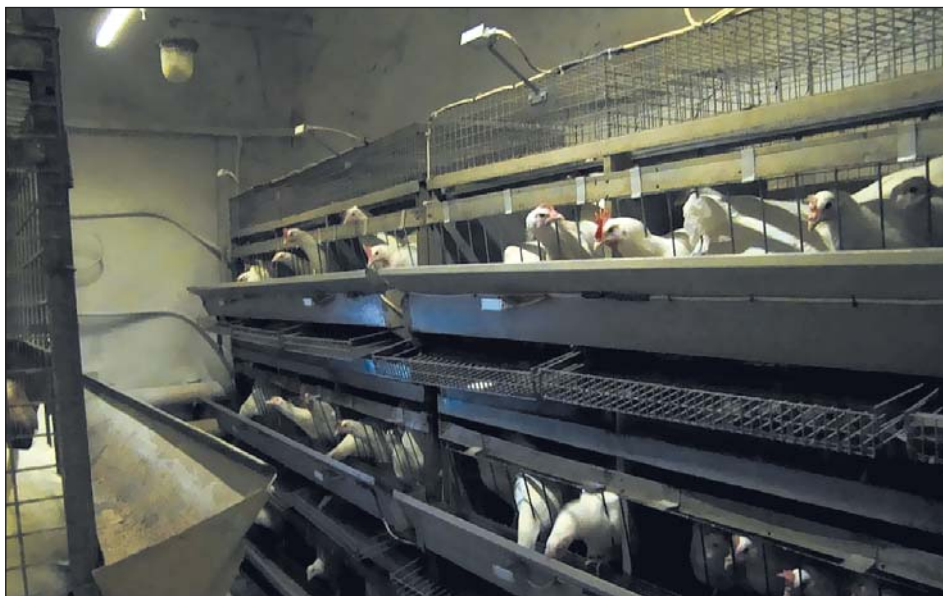
Рис. 9. Виварий Загорского экспериментального племенного хозяйства ВНИТИП г. Сергиев Посад. Исследования проводятся на оборудовании ИСО «Хамелеон»

институте птицеводства г. Сергиев Посад, позволяют существенно повысить продуктивные показатели в птицеводстве. В частности, по результатам исследований можно заключить, что при содержании яичных кур промышленного стада в клеточных батареях новый способ локального освещения светодиодными светильниками белого теплого спектра (2700–3500 К), по сравнению с традиционным способом, позволяет повысить: сохранность поголовья на 2,8–4,6%;